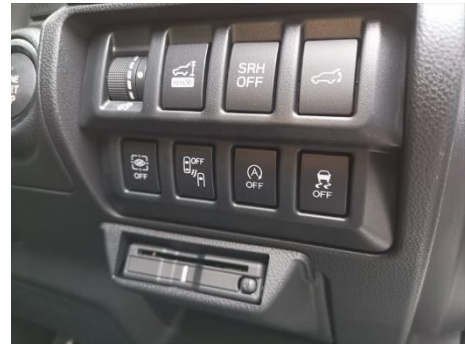
SUBARU フォレスター アイドリングストップ