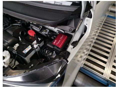
HONDA N-BOX 装着例