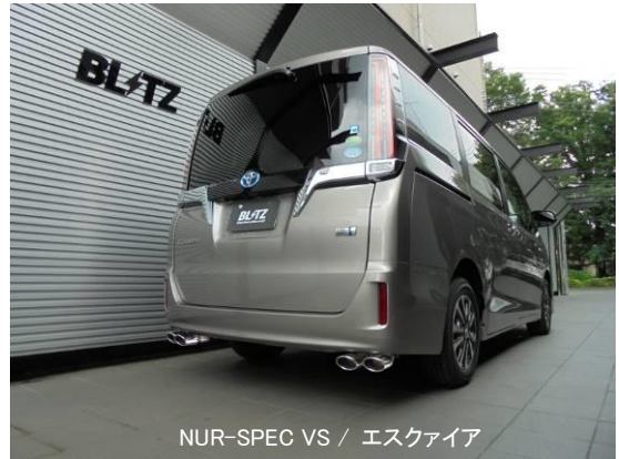
NUR-SPEC VS / エスクエア