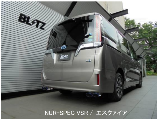
NUR-SPEC VSR / エスクエア