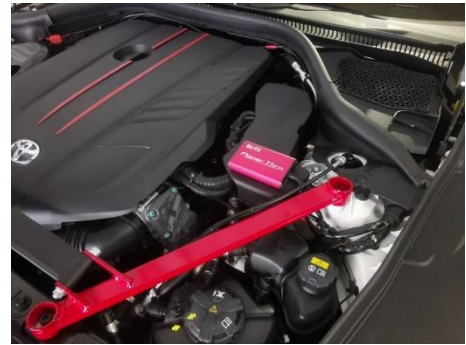
TOYOTA SUPRA RZ 装着例