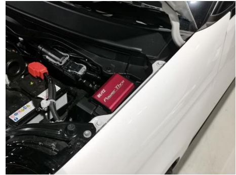
HONDA N-ONE 装着例