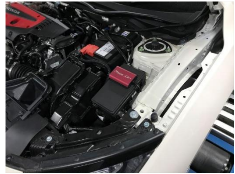
HONDA シビックタイプR 装着例