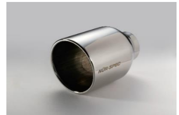
品番：62205 ステンレステール

商品に関するお問い合わせ【ブリッツ サポートセンター】 月曜～金曜 AM 10:00～ PM 17:00 / 〒202-0023 東京都西東京市新町4-7-6 TEL：0422-60-2277 FAX：0422-60-0066