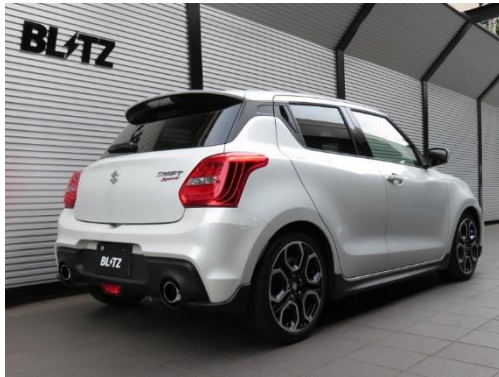
カスタムエディション VS / ステンレスカラーテール