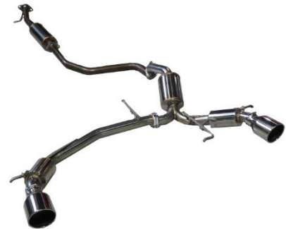
カスタムエディション VS / ステンレスカラーテール製品写真