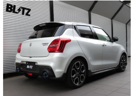
カスタムエディション VSR / チタンカラーテール