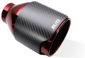
品番：62203 カーボンレッドテール単品