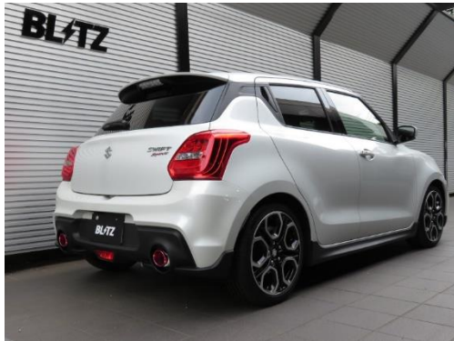
カスタムエディション CR / カーボンレッドテール