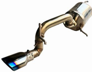
カスタムエディション VSR / チタンカラーテール