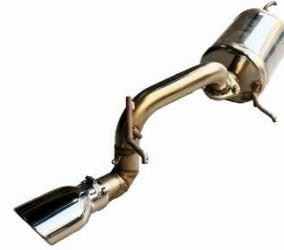
カスタムエディション VS / ステンレスカラーテール