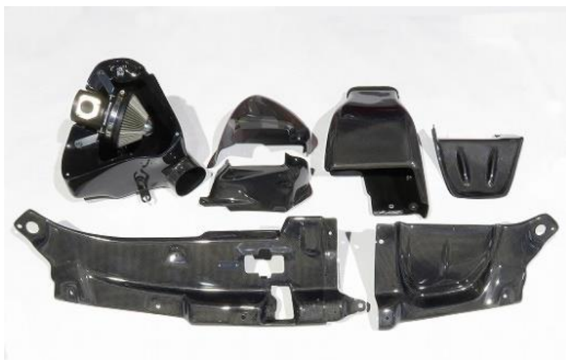
品番：27029 CARBON INTAKE SYSTEM アルファード用製品写真