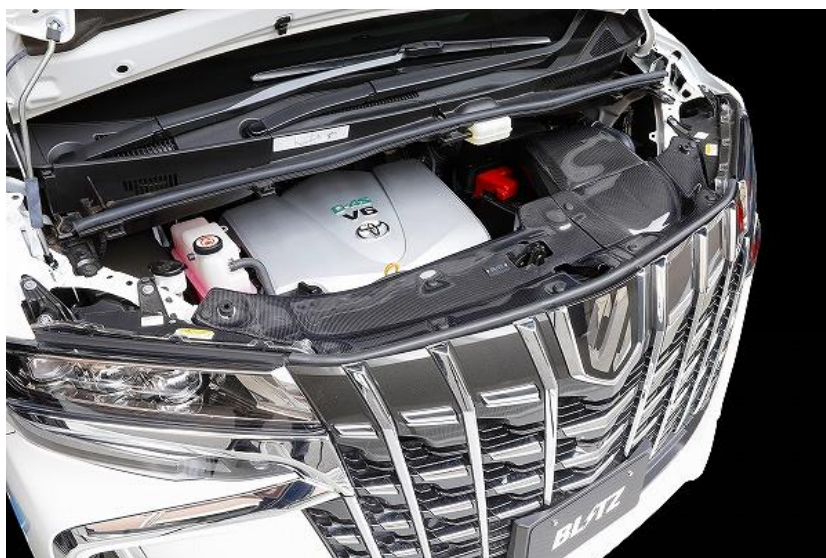
TOYOTA アルファード3.5L 装着写真

CARBON INTAKE SYSTEMに関する詳しい情報は こちらをクリックしてください。