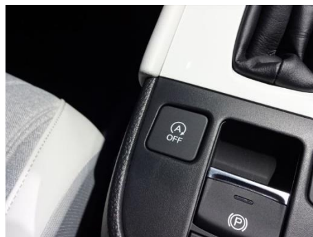
HONDA フィット アイドリングストップ