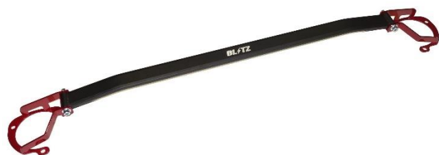
スバル BRZ ZD8 フロント用 製品写真