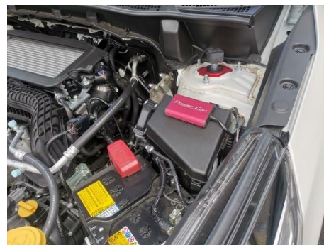
SUBARU フォレスター 装着例