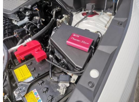
SUBARU レヴォーグ 装着例