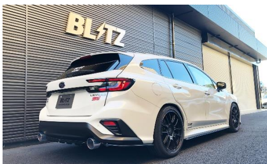
カスタムエディション VS / ステンレスカラーテール