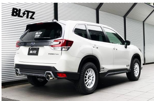
カスタムエディション VS / ステンレスカラーテール