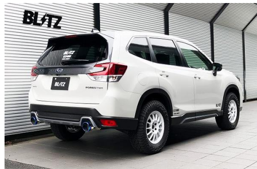
カスタムエディション VSR / チタンカラーテール