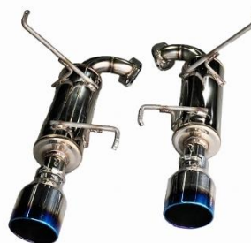
カスタムエディション VSR / チタンカラーテール