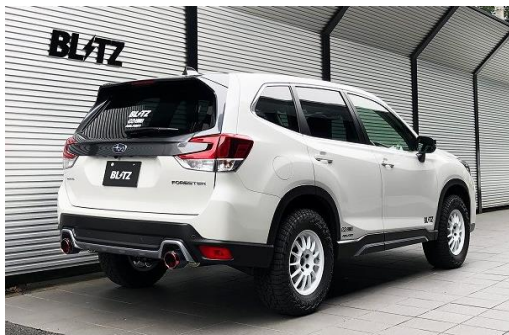
カスタムエディション CR / カーボンレッドテール