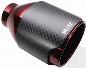
品番:62200 カーボンレッドテール (CR)