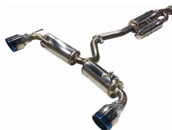
カスタムエディション VSR / チタンカラーテール