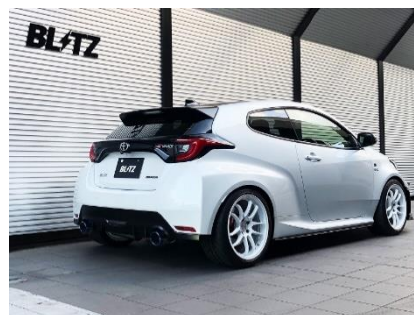
カスタムエディション VSR / チタンカラーテール