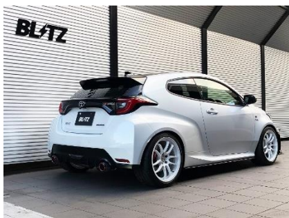
カスタムエディション CR / カーボンレッドテール