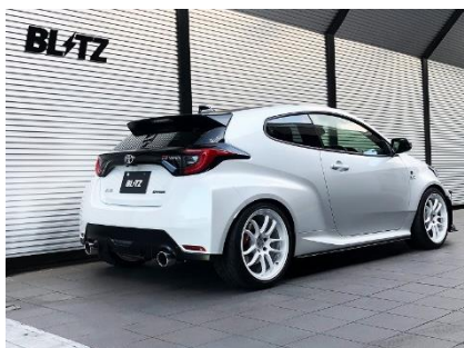
カスタムエディション VS / ステンレスカラーテール