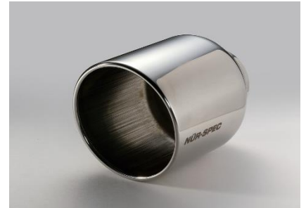
品番:62202 ステンレステール (VS)