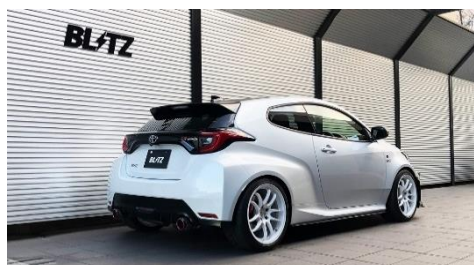
カスタムエディション CR / カーボンレッドテール