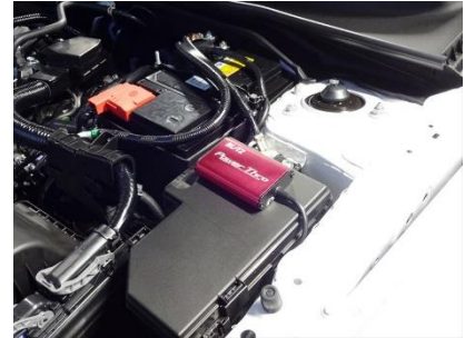
HONDA シビック 装着例