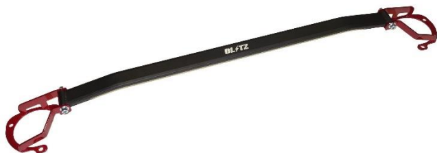
トヨタ GR86 ZN8 フロント用 製品写真