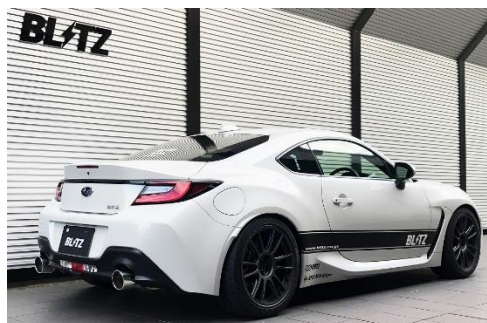
カスタムエディション VS / ステンレスカラーテール