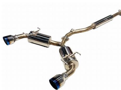
カスタムエディション VSR / チタンカラーテール