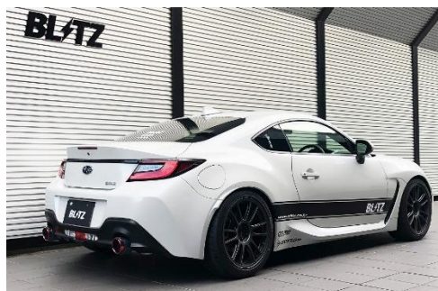
カスタムエディション CR / カーボンレッドテール