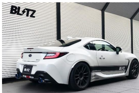
カスタムエディション VSR / チタンカラーテール