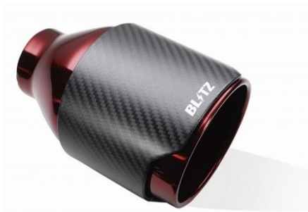
品番:62200 カーボンレッドテール (CR)