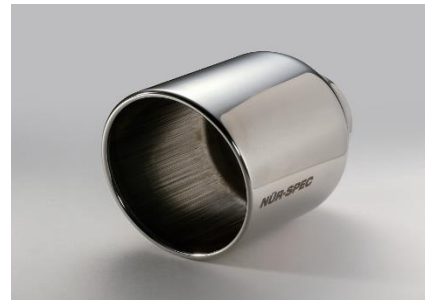
品番:62202 ステンレステール (VS)