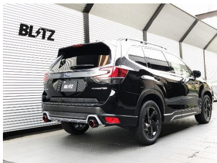
カスタムエディション CR / カーボンレッドテール