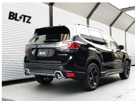
カスタムエディション VS / ステンレスカラーテール