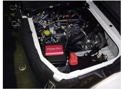
DAIHATSU アトレー 装着例