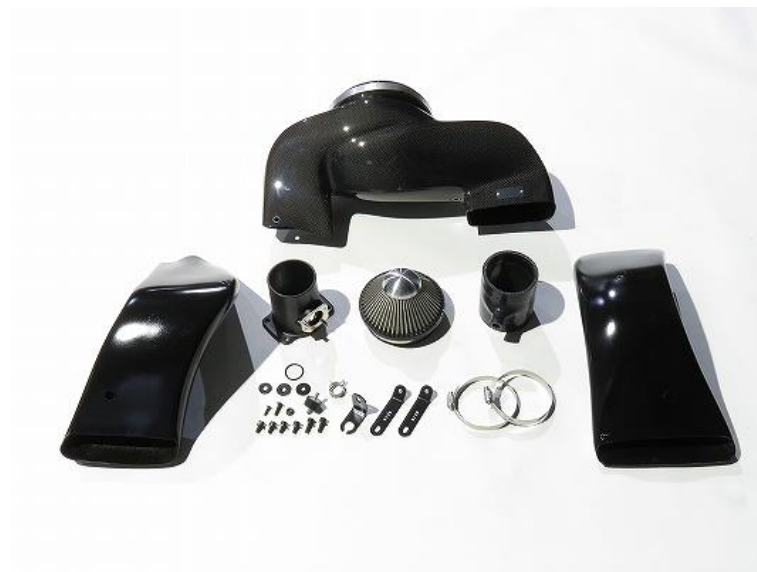
品番：27031 CARBON INTAKE SYSTEM GR86用製品写真