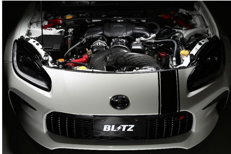
TOYOTA GR86(ZN8) 装着写真

CARBON INTAKE SYSTEMに関する詳しい情報は こちらをクリックしてください。