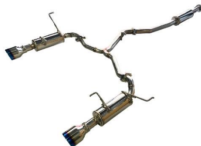
カスタムエディション VSR / チタンカラーテール