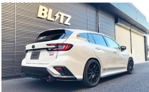
カスタムエディション CR / カーボンレッドテール