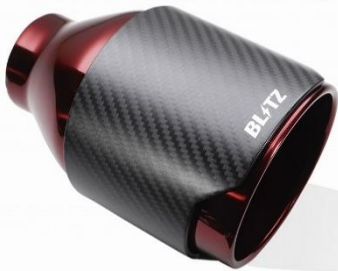
品番:62200 カーボンレッドテール (CR)