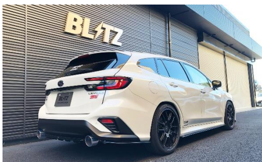
カスタムエディション VS / ステンレスカラーテール