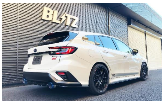
カスタムエディション VSR / チタンカラーテール