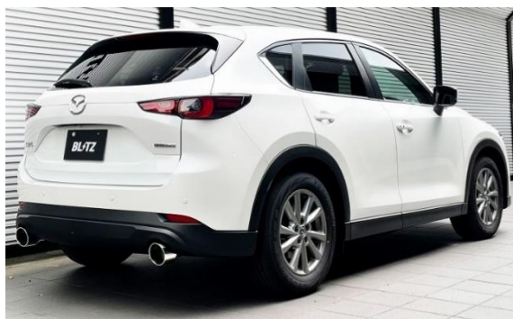
カスタムエディション VS / ステンレスカラーテール