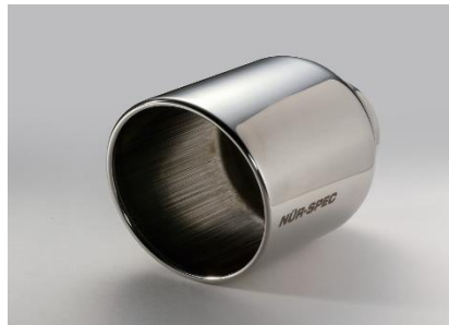
品番:62202 ステンレステール (VS)