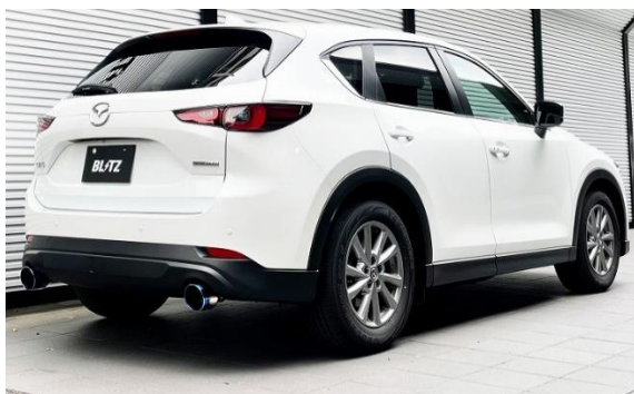
カスタムエディション VSR / チタンカラーテール