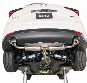
カスタムエディション VS / ステンレスカラーテール