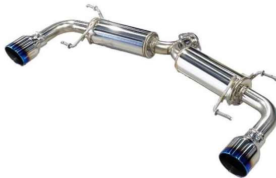
カスタムエディション VSR / チタンカラーテール