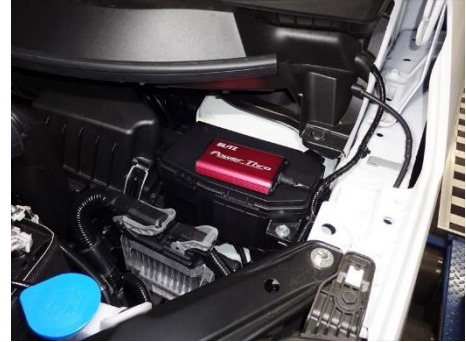
ステップワゴン 装着例