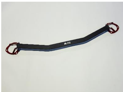
ホンダ シビック フロント用 製品写真