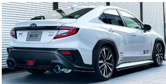
カスタムエディション VSR / チタンカラーテール