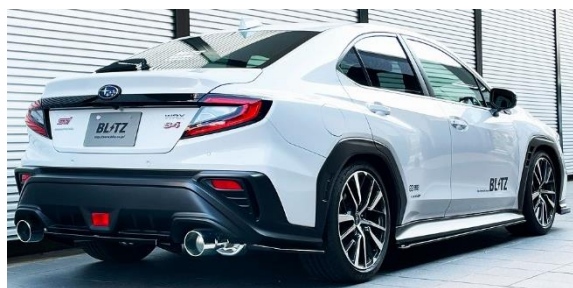
カスタムエディション VS / ステンレスカラーテール