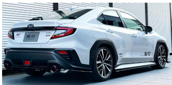
カスタムエディション CR / カーボンレッドテール