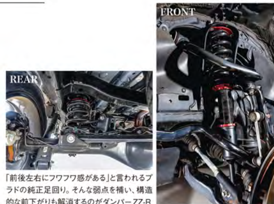
「前後左右にフワフワ感がある」と言われるプラドの純正足回り。そんな弱点を補い、構造的な前下がりが解消するのがダンパーZZ-R

とでベストの使用感になるのだ。 そしてお待ちかねと言ったように、ランクル300用のダンパーZZ-Rもどんどん開発が進む。年明けすぐにローダウンモデルがお披露目され、春にはリフトアップ用もリリースされる予定だ。気になる味付けは、若干柔らかく感じる純正の乗り心地をスポーティな方向に振るといふモノ。パネレートはフロント10.0kg/mm、リア4.5kg/mmで、このスプリングがボディと足まわり一体感をもたらす、至高のリンクをブリッツが求める走り味へと進化させる。名チューナーが腕によりをかけてパーツに、引き続き注目すべし!