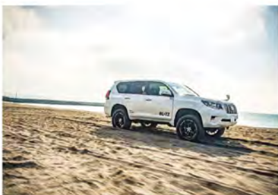
「快適な街乗り」をテーマに調整されているため、装着することでしなやかなアシの動きが実現。その上でアゲ・サゲのフォルムが作れる!