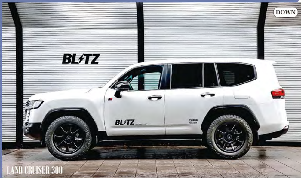
LAND CRUISER 300