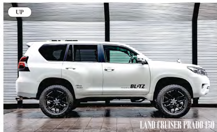
LAND CRUISER PRADO 150