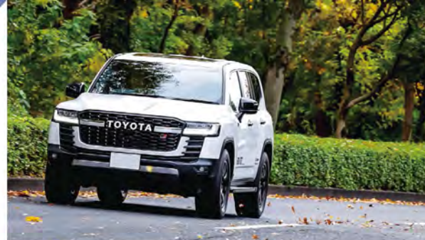
V6ツインターボエンジンが純正でも十分な走りを披露するランクル300。そこへキビキビした、スポーティな味付けを施したのがポイント