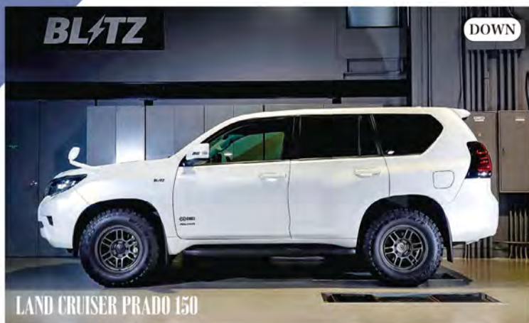
LAND CRUISER PRADO 150