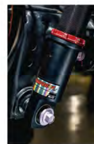
乗り味の変化を最小限に留めながら、車高調整を可能にする全長調整式。アゲ用とサゲ用ではケース長が異なっているのがポイント

とでベストの使用感になるのだ。 そしてお待ちかねと言ったように、ランクル300用のダンパーZZ-Rもどんどん開発が進む。年明けすぐにローダウンモデルがお披露目され、春にはリフトアップ用もリリースされる予定だ。気になる味付けは、若干柔らかく感じる純正の乗り心地をスポーティな方向に振るといふモノ。パネレートはフロント10.0kg/mm、リア4.5kg/mmで、このスプリングがボディと足まわり一体感をもたらす、至高のリンクをブリッツが求める走り味へと進化させる。名チューナーが腕によりをかけてパーツに、引き続き注目すべし!