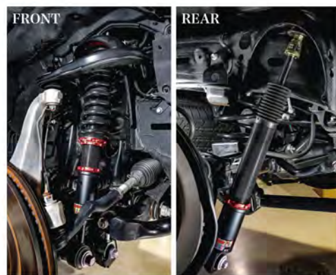
ラグジュアリーな乗り心地に設定され、若干柔らかめな純正の足回り。このZZ-Rは32段の減衰力調整で好みにセッティングできる