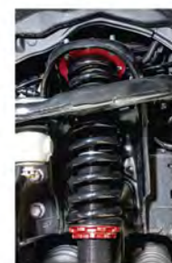
耐久性に優れた特殊高張力材を使用したオリジナルスプリング。プラド用のパネレートは①18.0kg/mm、②5.0kg/mm。ランクル300用は①10.0kg/mm、②4.5kg/mmとなる