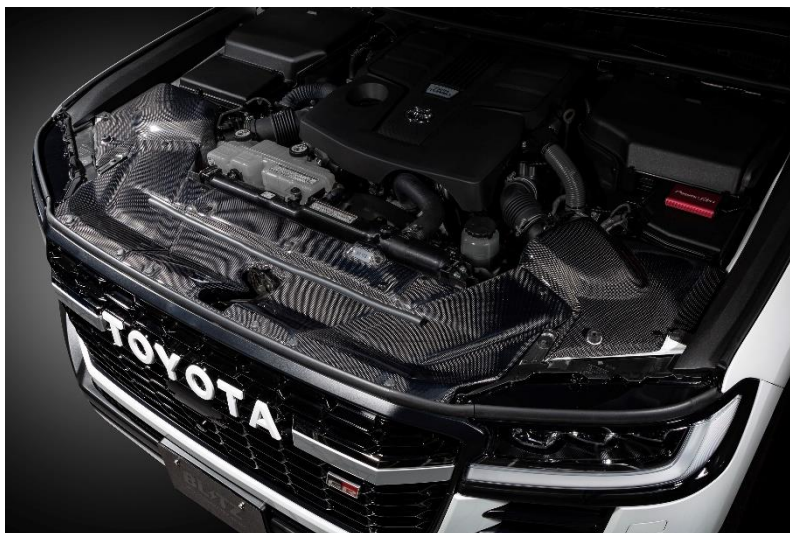
TOYOTA LAND CRUISER (VJA300W)装着写真

CARBON INTAKE SYSTEMに関する詳しい情報は こちらをクリックしてください。