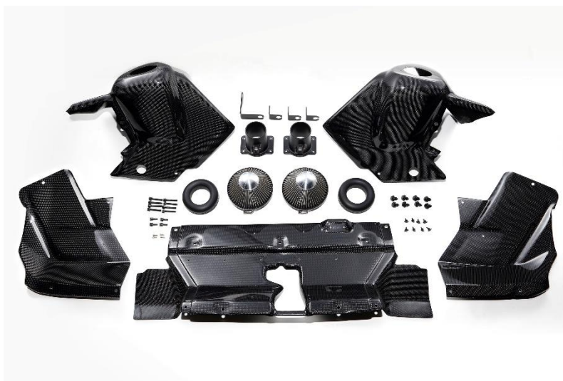
CARBON INTAKE SYSTEM 製品写真