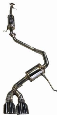
カスタムエディション VS / ステンレスカラーテール