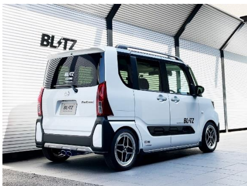
カスタムエディション VSR / チタンカラーテール