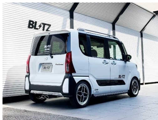
カスタムエディション VS / ステンレスカラーテール