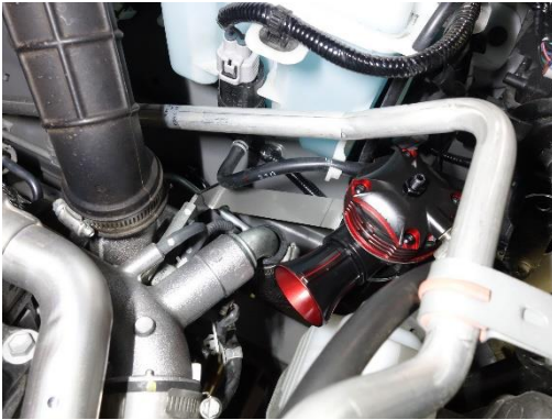
JIMNY (JB64W) Release Type 装着写真