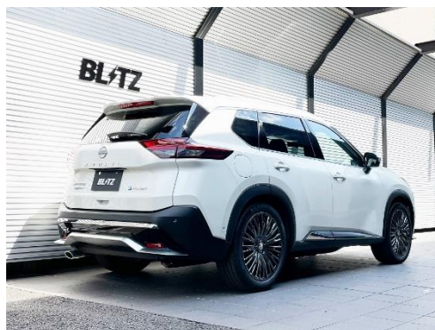
カスタムエディション VS / ステンレスカラーテール