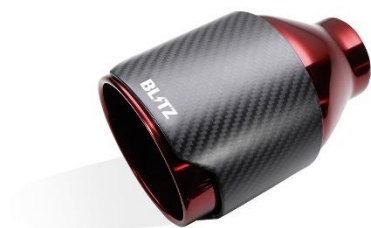
コードNo.62203 カーボンレッドテール (CR)