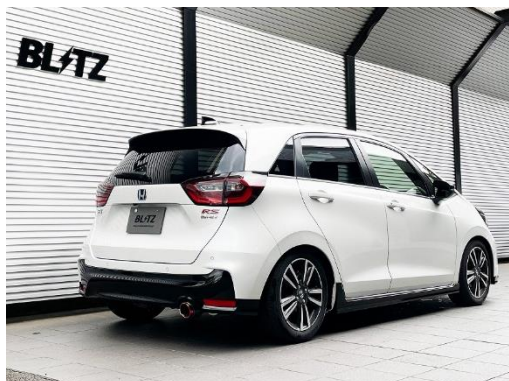
カスタムエディション CR / カーボンレッドテール