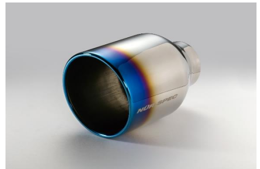
コードNo.62204 チタンカラーステンレステール (VSR)