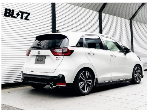
カスタムエディション VS / ステンレスカラーテール