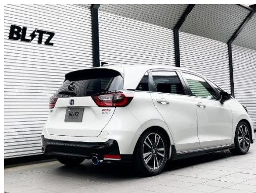
カスタムエディション VSR / チタンカラーテール