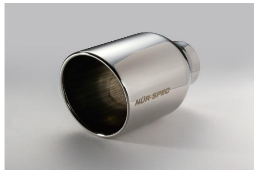
コードNo.62205 ステンレステール (VS)