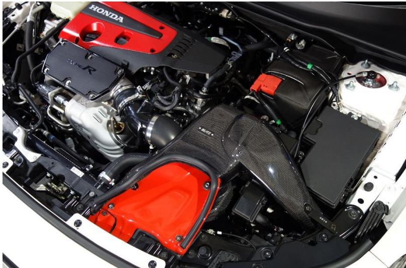
HONDA CIVIC TYPE R (FL5)装着写真

CARBON INTAKE SYSTEMに関する詳しい情報は こちらをクリックしてください。