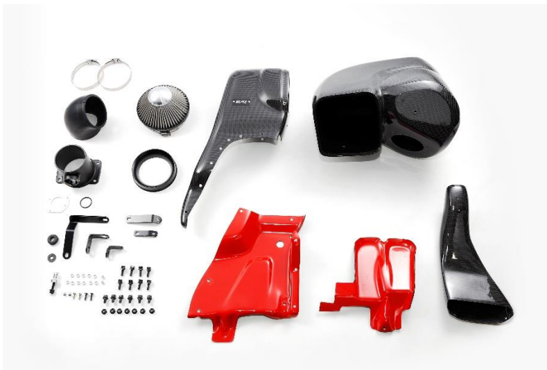
CARBON INTAKE SYSTEM 製品写真