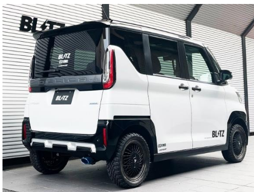
カスタムエディション VSR / チタンカラーテール