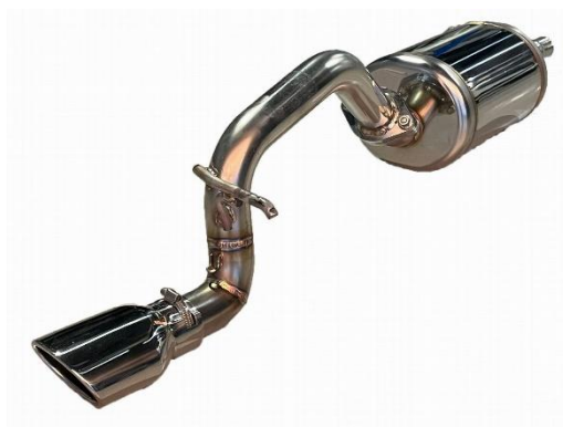
カスタムエディション VS / ステンレスカラーテール