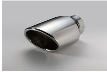
コードNo.62207 ステンレステール (VS)