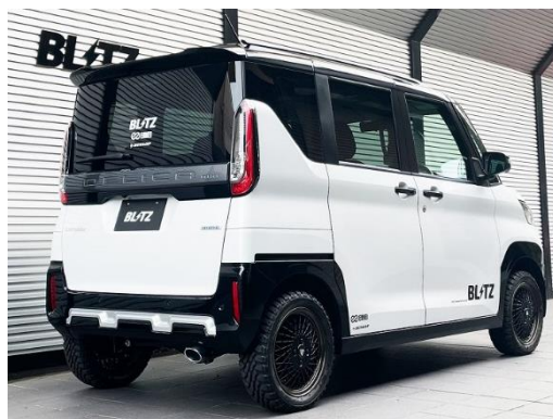
カスタムエディション VS / ステンレスカラーテール