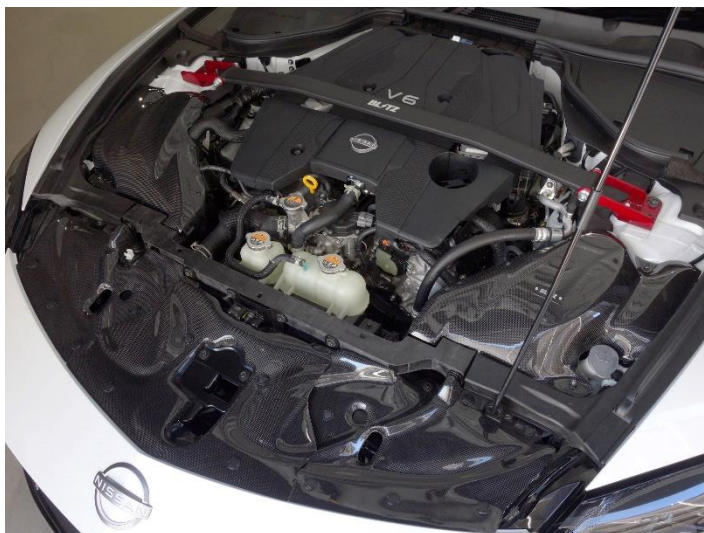
NISSAN FAIRLADY Z (RZ34)装着写真

CARBON INTAKE SYSTEMに関する詳しい情報は こちらをクリックしてください。