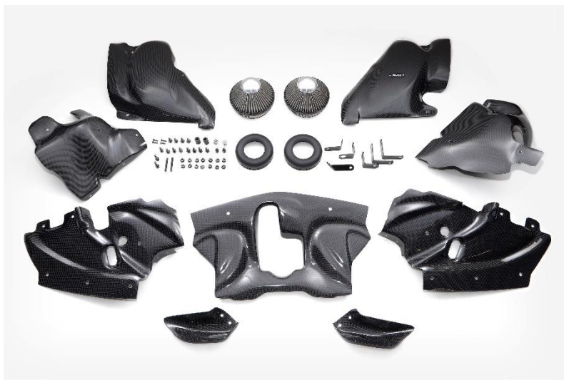
CARBON INTAKE SYSTEM 製品写真