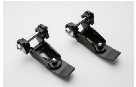
MIRACLE STROKE ADJUSTERに関して詳しくは、こちらをクリック！