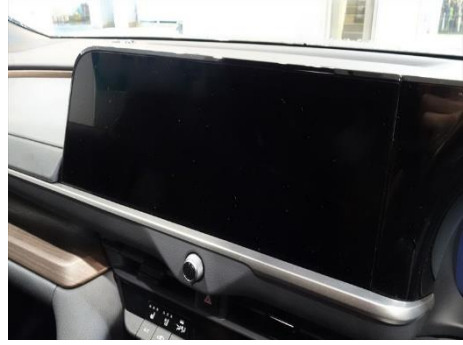
トヨタ クラウン AZSH32