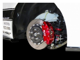
TOYOTA GR86 ZN8 Front 6POT・Rear 4POT 装着写真