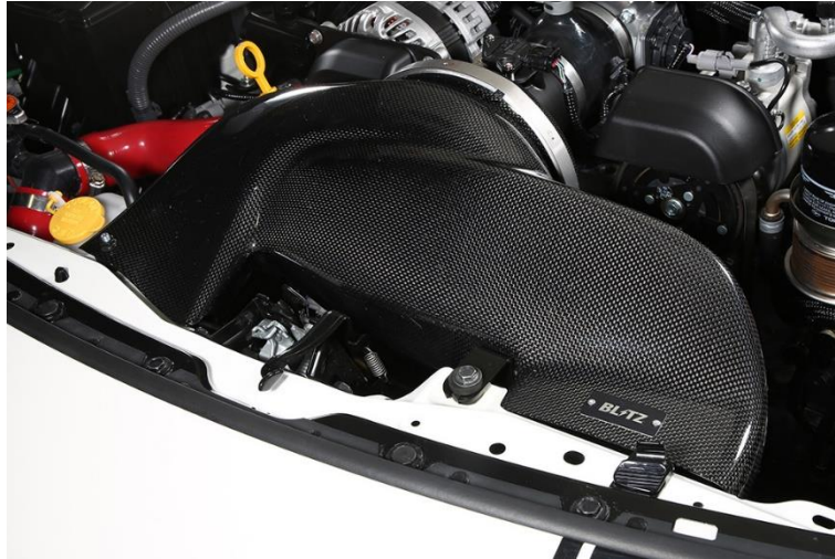
TOYOTA GR86(ZN8) 装着写真

CARBON INTAKE SYSTEMに関する詳しい情報は こちらをクリックしてください。