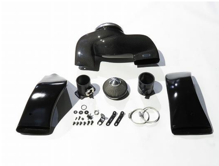
GR86/BRZ(ZN8/ZD8)用 CARBON INTAKE SYSTEM製品写真