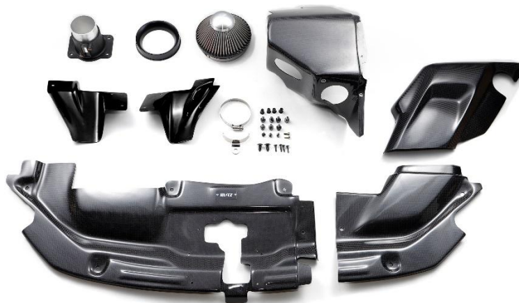
TOYOTA PRIUS PHEV (MXWH61)用 CARBON INTAKE SYSTEM 製品写真