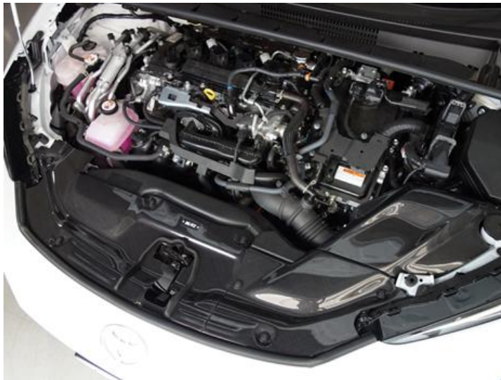
TOYOTA PRIUS PHEV (MXWH61) 装着写真

CARBON INTAKE SYSTEMに関する詳しい情報は こちらをクリックしてください。