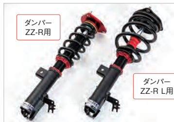
ダンパー ZZ-R L用