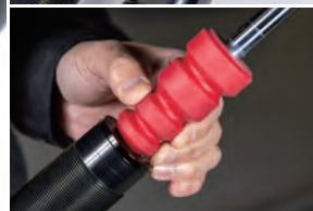
ダンパー ZZ-R L用