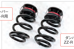
ダンパー ZZ-R L用