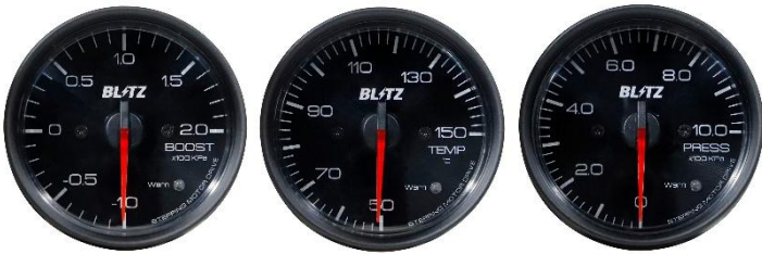
メーターデザイン