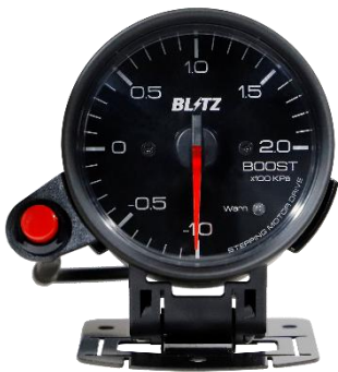
メーターホルダー装着