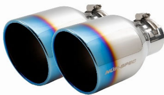
62204:チタンカラーステンステール