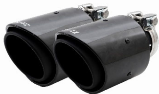
62209:フォージドカーボンテール