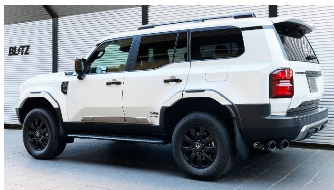
フォージドカーボンテール装着車 ※MODELLISTAエアロ装着車