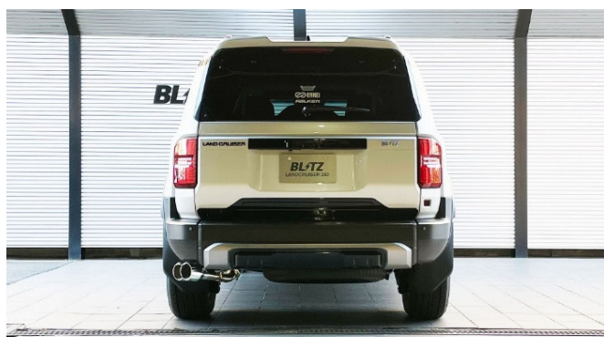
ステンレステール装着車 ※MODELLISTAエアロ装着車