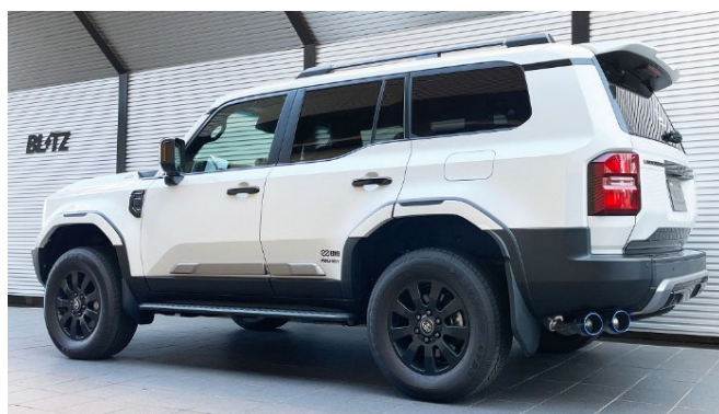
チタンカラーテール装着車 ※MODELLISTAエアロ装着車