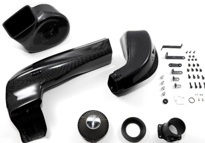
VELLFIRE (TAHA40W) CARBON INTAKE SYSTEM製品写真