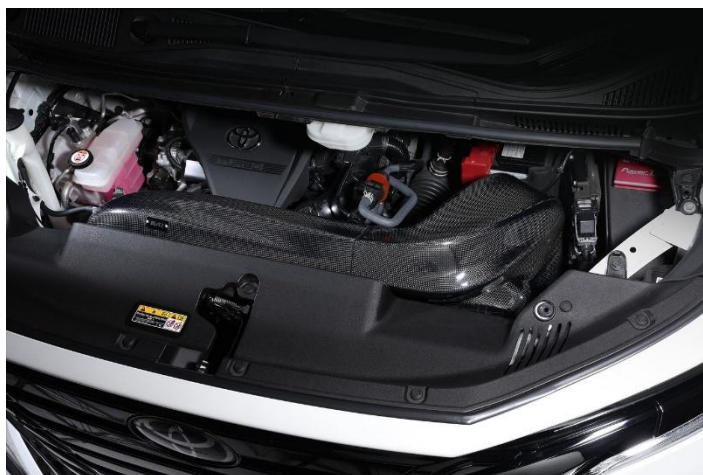
VELLFIRE (TAHA40W) 装着写真

CARBON INTAKE SYSTEMに関する詳しい情報は こちらをクリックしてください。